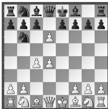
POSITION DE BASE

Sans prendre de risque, les blancs s'emparent du centre, obtiennent un petit avantage d'espace en développant leurs pièces sur leurs cases naturelles.